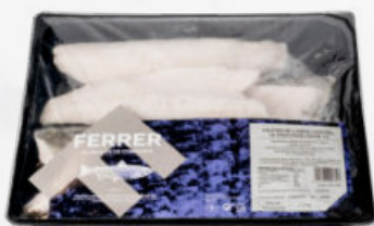
FILETES DE LUBINA