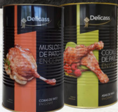
MUSLO Y CODILLO CONFITADO

52165 Muslo confitado de pato · 10u./lata