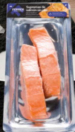
SUPREMAS DE SALMÓN SIN PIEL