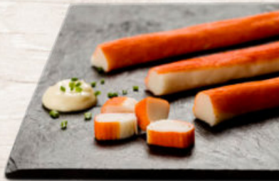
PALITOS DE MAR KRISSIA