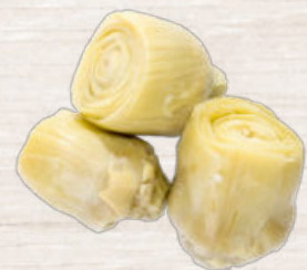
CORAZONES DE ALCACHOFA BABY