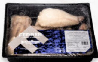
COLAS DE RAPE DE NAMÍBIA SIN PIEL HIGIENIZADAS