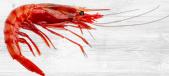
GAMBA YEYE 3 CARABELAS ALISTADO

4668 350g/u. · 2x4u. 2504 350-400g · 1x5kg