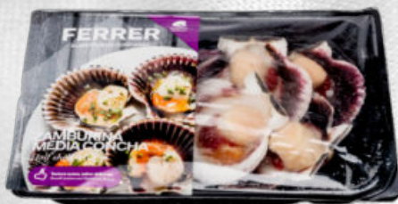
ZAMBURIÑA MEDIA CONCHA