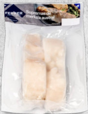
SUPREMAS DE MERLUZA AUSTRAL