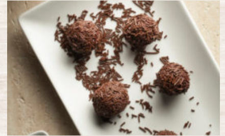
TRUFAS DE CHOCOLATE