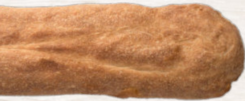
“COCA” DE FOLGUEROLAS