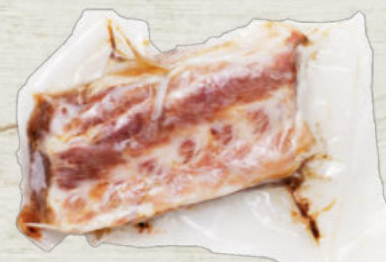
COSTILLA DE CERDO RIBS CONFITADA