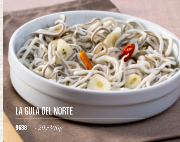
LA GULA DEL NORTE