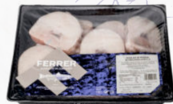
RODAJAS DE ROSADA SELECTA HIGIENIZADAS