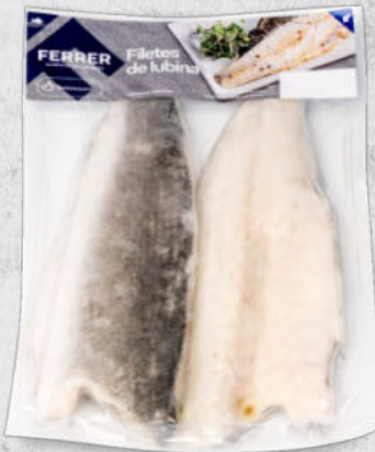
FILETES DE LUBINA