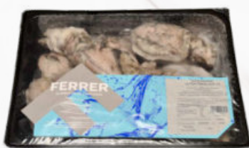
SEPIA FRANCESA ENTERA