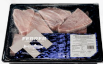
LOMO DE ATÚN EN RODAJAS