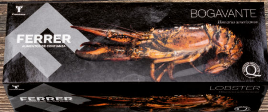
BOGAVANTE CRUDO AMERICANO