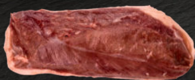
MAGRET DE PATO