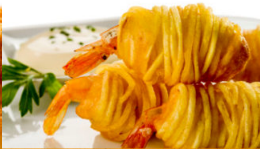
CRUJIENTE DE LANGOSTINO CON PATATA