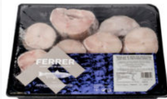
RODAJAS DE MERLUZA ARGENTINA