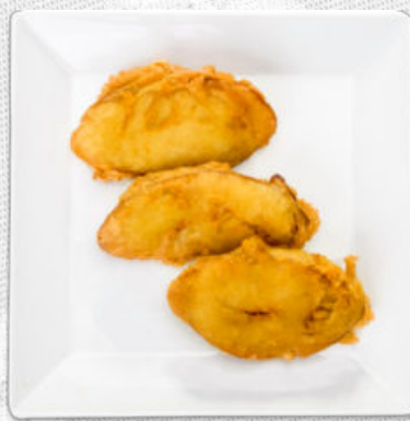
PATATAS DE OLOT