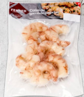
COLAS DE GAMBÓN PELADAS