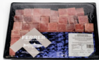
DADOS DE ATÚN "YELLOWFIN"

4659 9~15u./envase · 2x1,5kg 4658 · 2x1,5kg