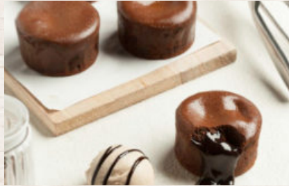
COULANT DE CHOCOLATE