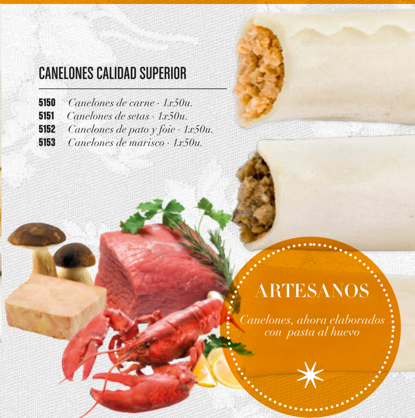
CANELONES CALIDAD SUPERIOR