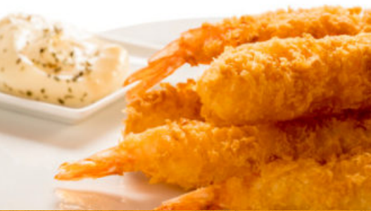
TORPEDO DE LANGOSTINO