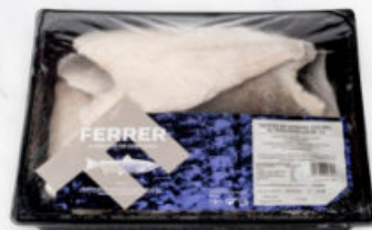
FILETES DE DORADA