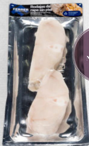
RODAJAS DE RAPE