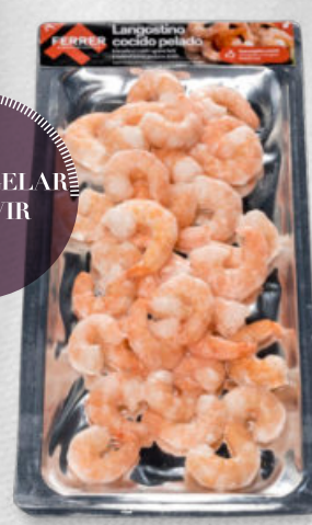
LANGOSTINO PELADO COCIDO