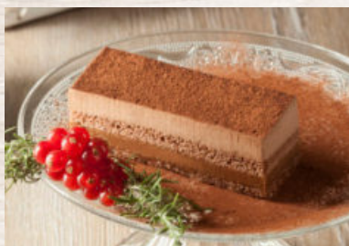
BANDA DE CHOCOLATE CRUJIENTE