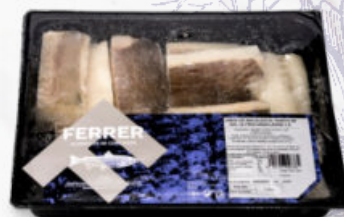
LOMOS DE BACALAO DE ISLANDIA