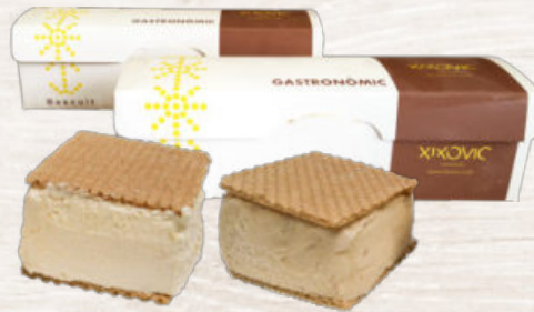
BLOQUES DE HELADO ARTESANAL

5095 Biscuit · 6x1000ml · 1x7 raciones 5096 Turrón · 6x1000ml · 1x7 raciones