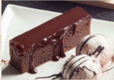
LINGOTE FONDANT CON CHOCOLATE