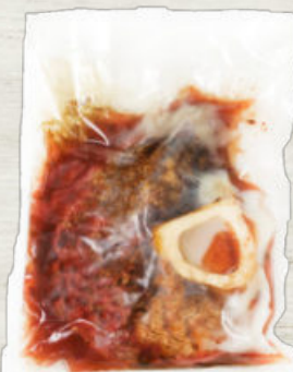
OSOBUCO DE VACUNO CONFITADO