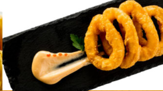
ANILLAS A LA ROMANA