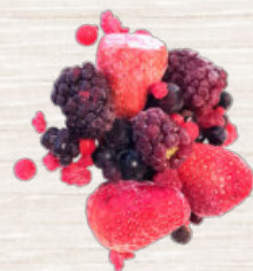
FRUTAS DEL BOSQUE