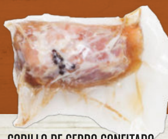
CODILLO DE CERDO CONFITADO

Añade tu toque ¡Excelente resultado y sabor!