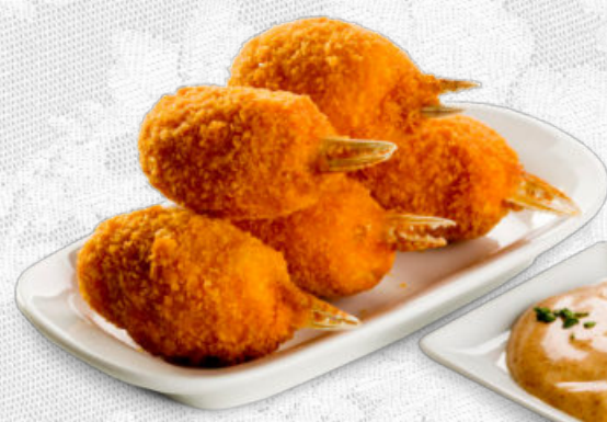
MUSLITOS DE MAR