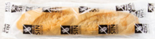
BAGUETTINA SIN GLUTEN