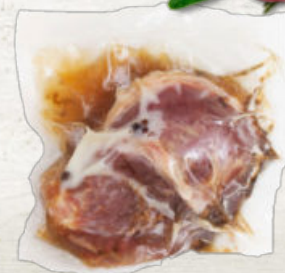
CARRILLADA DE CERDO CONFITADA