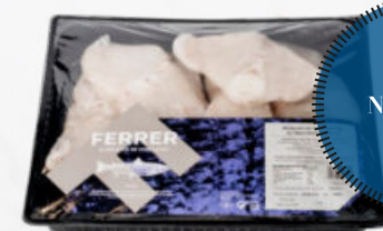
RODAJAS DE RAPE HIGIENIZADAS