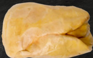
HÍGADO DE PATO