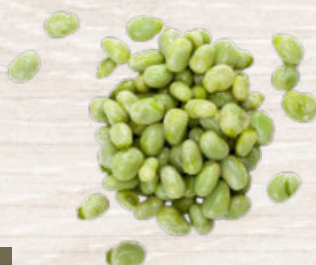
HABAS SUPER BABY

6034 Grueso 16-22cm/u. · 5x1kg 6035 Mediano 10-16cm/u. · 5x1kg