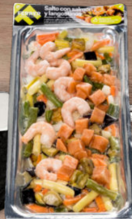
SALTO DE VERDURAS, SALMÓN AHUMADO Y LANGOSTINOS