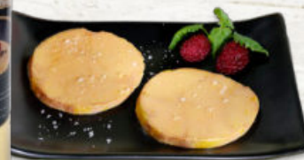
BLOQUE DE FOIE TROCEADO