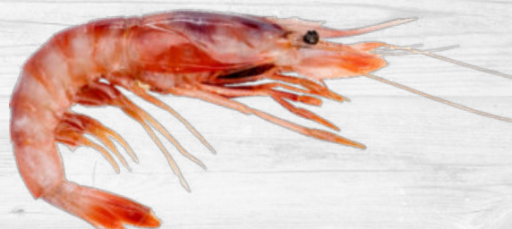
GAMBA DE LA COSTA

4669 200-300g · 2x6u. 2247 200-300g · 2x6kg