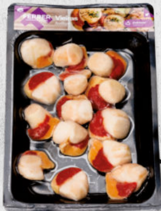
CARNE DE VIEIRA