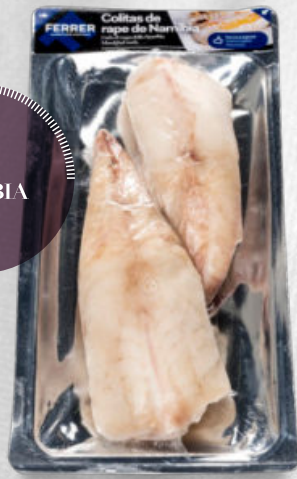
COLITAS DE RAPE