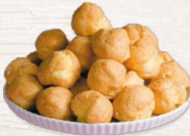
PROFITEOLES DE NATA