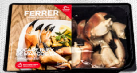
BOCA DE BUEY DE MAR COCIDA