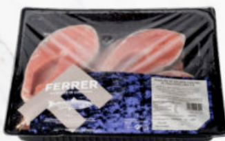
RODAJAS DE SALMÓN