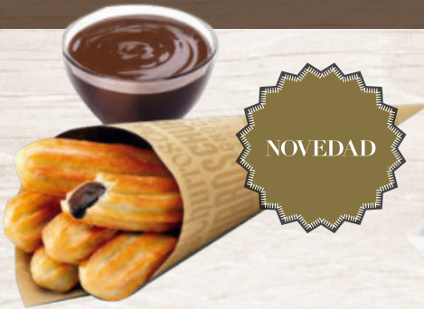
CHURROS RELLENOS DE CHOCOLATE