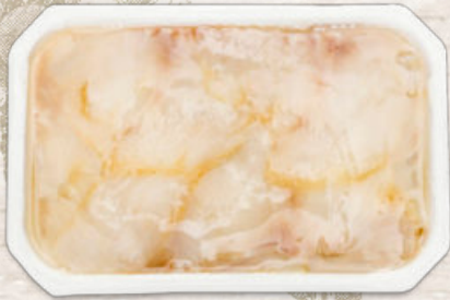
CARPACCIO DE BACALAO