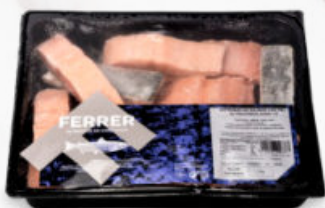
SUPREMAS DE SALMÓN CON PIEL