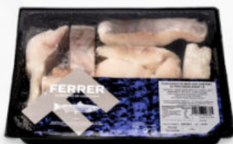
PORCIONES DE MERLUZA AUSTRAL