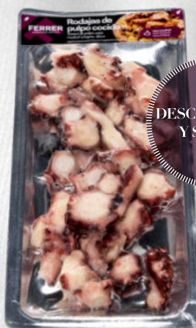
PULPO COCIDO TROCEADO