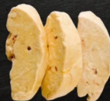
ESCALOPAS DE FOIE