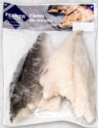
FILETES DE DORADA