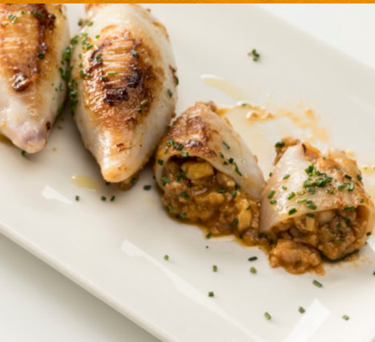
CALAMAR RELLENO DE CARNE