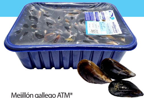
Mejillón gallego ATM* 9320 6 x 2 kg | Vida útil: 8~11 días 465 1 x 5 kg | Vida útil: 8~11 días