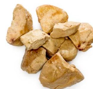
Hígado de pato troceado 9052 10 x 1 kg Vida útil: 18 meses