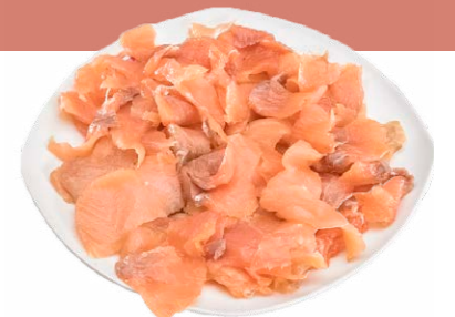
Recortes de salmón ahumado 9615 5 x 1 kg Vida útil: 18 meses