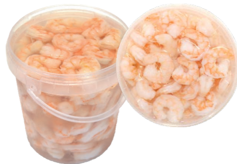
Langostino pelado y cocido 192 G | 1 x 1,5 kg (P.Esc: 900 g) | Vida útil: 30 días 269 M | 1 x 1,5 kg (P.Esc: 900 g) | Vida útil: 30 días 193 P | 1 x 1,5 kg (P.Esc: 900 g) | Vida útil: 30 días