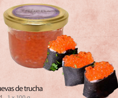
Huevas de trucha 284 1 x 100 g Vida útil: 180 días