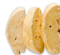
Escalopos de foie gras 55080 40 g/un | 5 x 1 kg Vida útil: 18 meses