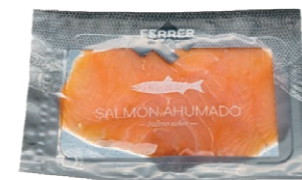
Sobre de salmón ahumado 9607 6 x 100 g Vida útil: 35 días