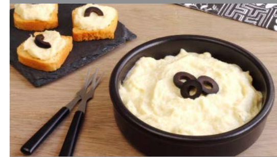
Tarrina de brandada de bacalao 52808 8 x 150 g Vida útil: 3 meses