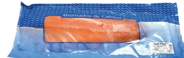
Plancha de salmón ahumado precortado 52935 1,1~ 1,5 kg/un Vida útil: 12 meses