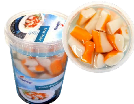
Surimi de cangrejo en salmuera 270 1 x 1,5 kg (P.Esc: 900 g) Vida útil: 30 días