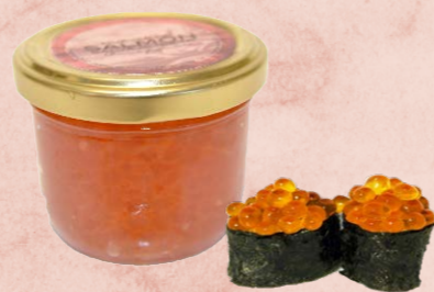
Huevas de salmón 285 1 x 100 g Vida útil: 180 días