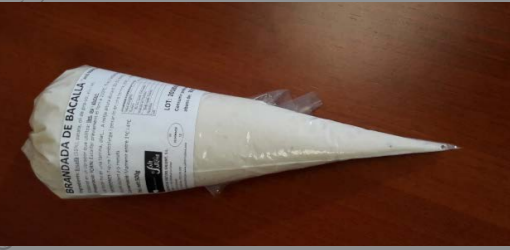
Manga de brandada de bacalao 52813 6 x 500 g Vida útil: 3 meses