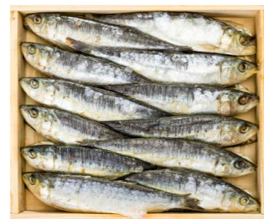
Sardinas en salazón 9009 1 x 24 un Vida útil: 6 meses