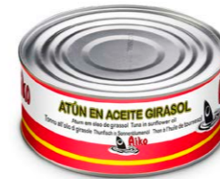
Lata de atún en aceite de girasol 53039 12 x 900 g (P.Esc: 650 g) Vida útil: 6 años