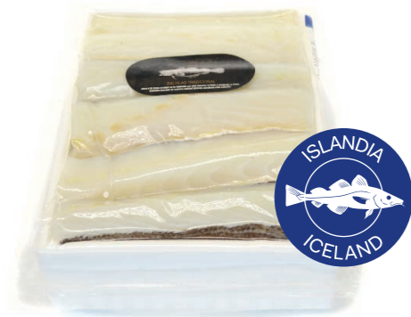
Lomo de bacalao desalado extra 259 1 x 3,5 kg aprox Vida útil: 15~20 días