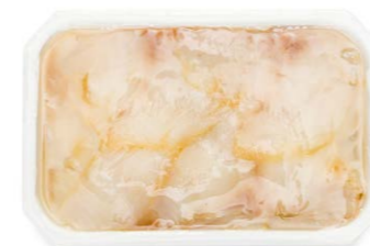
Carpaccio de bacalao en aceite 9006 1 x 1 kg (P. Esc: 700 g) Vida útil: 12 meses