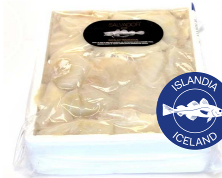
Bacalao desmigado desalado 132 1 x 2 kg Vida útil: 15~20 días