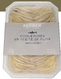
Boquerón en aceite de oliva 51514 10 x 500 g Vida útil: 4 meses