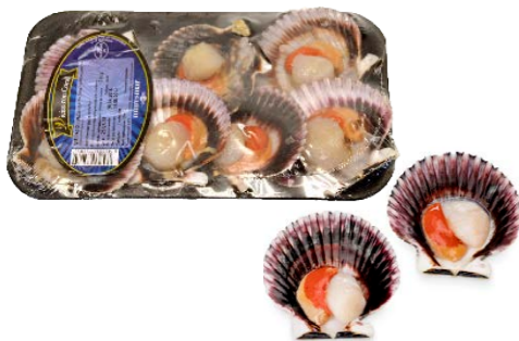
Zamburiña media concha 9322 5~6 un/envase | 1 x 250 g aprox. Vida útil: 8 días