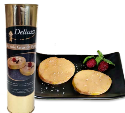
Bloque de foie gras de pato con trozos 9682 ~950 g/un Vida útil: 9 meses