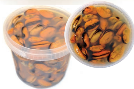
Carne de mejillón en salmuera 494 1 x 1,5 kg (P.Esc: 900 g) Vida útil: 30 días