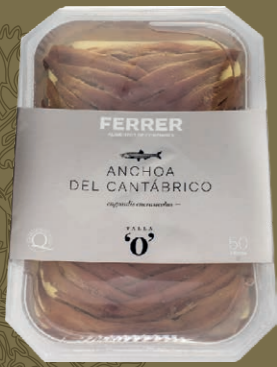
Anchoa del Cantábrico N°0 51513 50 filetes | 1 x 14 es Vida útil: 4 meses