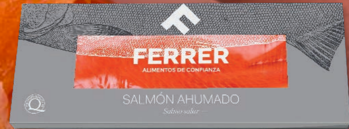
Plancha de salmón ahumado 9603 Precortado | 1 x 1,4 kg | Vida útil: 35 días 9690 Entero | 1 x 1,4 kg | Vida útil: 35 días