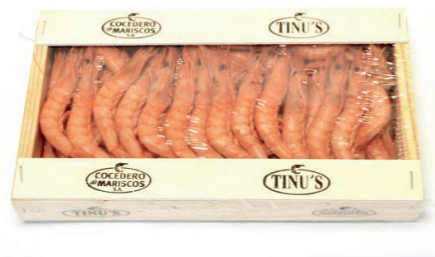
Gamba saladada 180 1 x 500 g Vida útil: 5 días