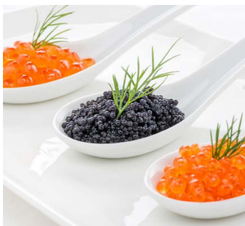
Huevas de esturión (Caviar iraní) 289 1 x 30 g Vida útil: 4 meses