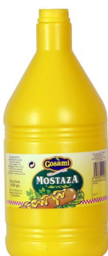
Garrafa de mostaza 53036 1,85 L Vida útil: 18 meses