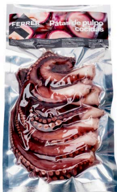
Patas de pulpo cocidas

252 Grandes | 2 un | ~ 300 g aprox. Vida útil: 30 días