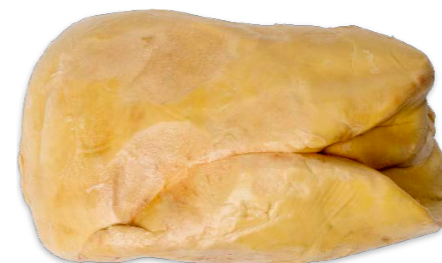
Hígado de pato extra 55079 600-700 g/un Vida útil: 18 meses