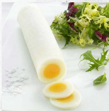
Huevo duro barra 54020 10 x 300 g Vida útil: 18 meses