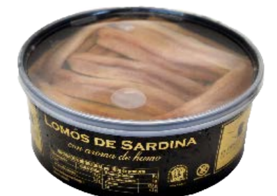
Filetes de sardina ahumados 290 1 x 1 kg (P.Esc: 700 g) Vida útil: 60 - 90 días