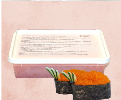
Huevas de pez volador (Tobiko) 489 1 x 500 g Vida útil: 2 años