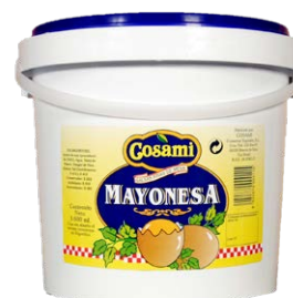
Cubo de mayonesa Cosami 53034 3,6 L Vida útil: 18 meses