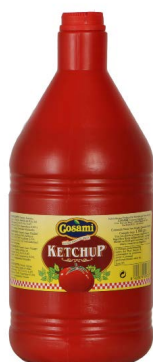
Garrafa de ketchup 53035 1,85 L Vida útil: 18 meses