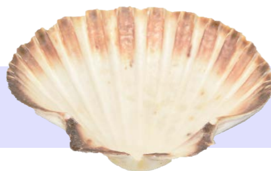
Concha de vieira 013 Vida útil: -