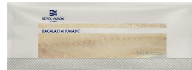
Plancha de bacalao ahumado precortado 7259 0,7~ 1,3 kg/un | a peso Vida útil: 30 días