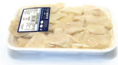
Desmigado salado "Maruca" 9014 10 x 1 kg Vida útil: 12 meses