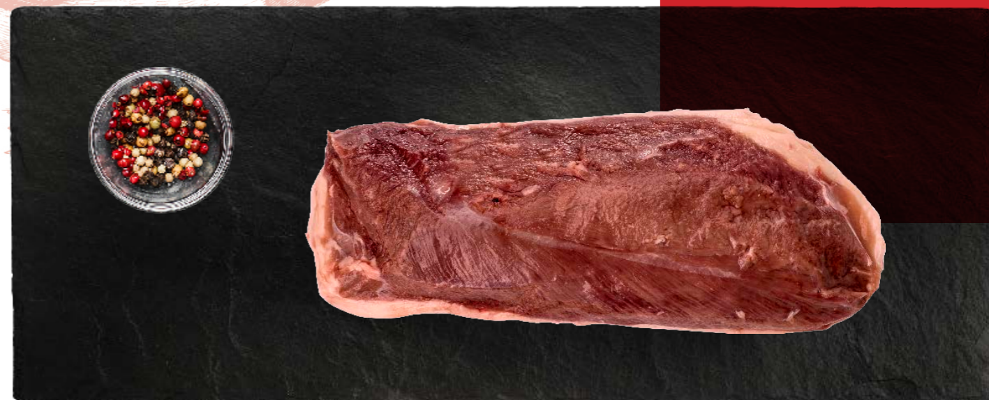
Magret de pato 55078 ~350 g/un Vida útil: 18 meses