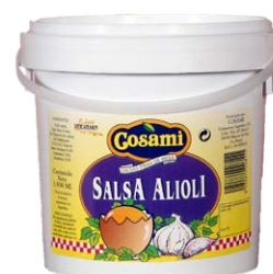
Cubo de alioli 53037 1,75 L Vida útil: 18 meses