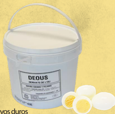
Huevos duros 52805 1 x 40 un Vida útil: 60 días