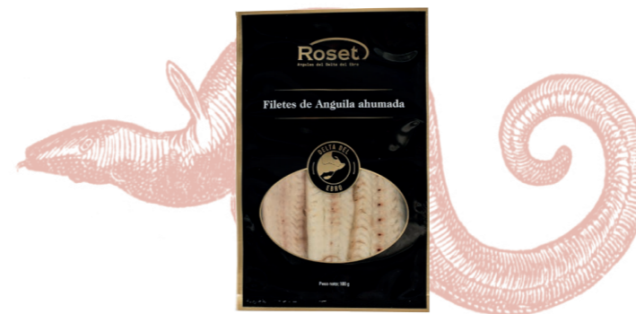
Filetes de anguila ahumada 467 1 x 100 g Vida útil: 30~60 días