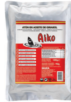
Bolsa de atún en aceite de girasol 53038 16 x 1 kg (P.Esc: 950 g) Vida útil: 3 años