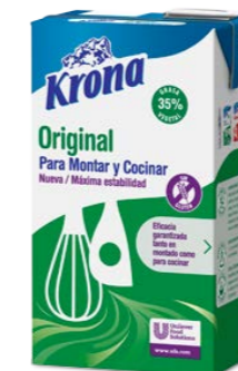
Krona original 174344 8 x 1 L Vida útil: 182 días