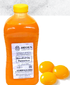
Yema de huevo pasteurizada 52800 10 x 1 L Vida útil: 30 días