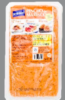
Pincho de marisco 9670 12 x 500 g Vida útil: 60 días