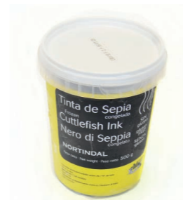
Tarro de tinta de sepia 9633 15 x 500 g Vida útil: 2 años