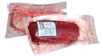
Ventresca de atún P

396 2~4 kg/un | a peso Vida útil: 10 días