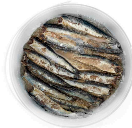
Cubo de anchoas en salazón 9005 1 x 150 un | Vida útil: 12 meses 701301 Grandes sup. | 100~ 110 un