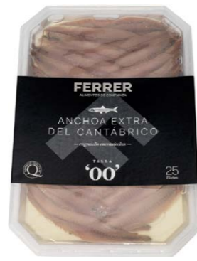
Anchoa del Cantábrico N°00 51512 25 filetes | 1 x 12 es Vida útil: 4 meses