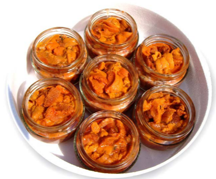
Yemas de erizo de mar 510 7 x 130 g Vida útil: 12 meses