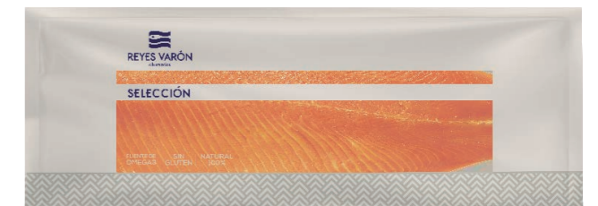
Trucha ahumada precortada 1132 0,6~ 1,0 kg/un | a peso Vida útil: 30 días