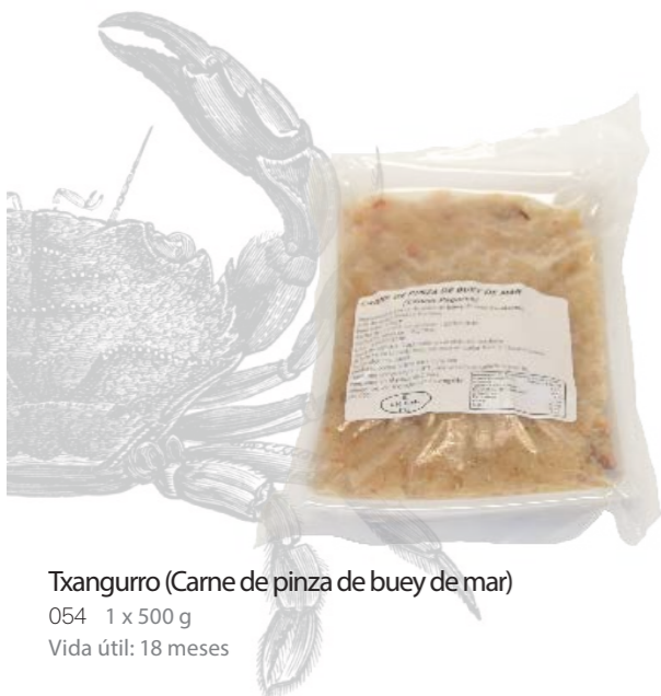
Txangurro (Carnes de pinza de buey de mar) 054 1 x 500 g Vida útil: 18 meses