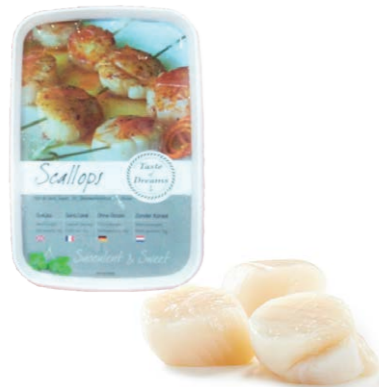
Carne de vieira 081 18~24 un/kg | 1 x 1 kg | Vida útil: 11 días 080 26~32 un/kg | 1 x 1 kg | Vida útil: 11 días