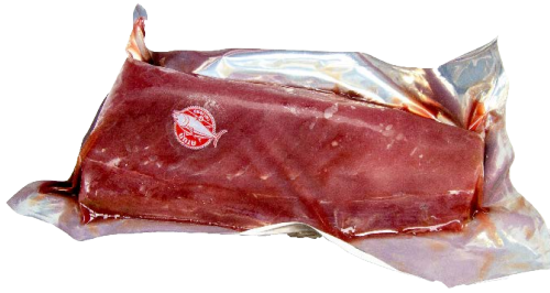
Lomo de atún envasado al vacío

186 2~4 kg/un | a peso Vida útil: 10 días