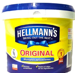
Cubo de mayonesa Hellmann's 103770 5 L Vida útil: 270 días