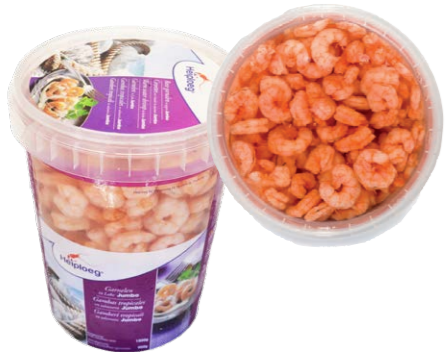
Tarro de gamba pelada Jumbo 464 1 x 1,5 kg (P.Esc: 900 g)