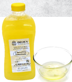
Clara de huevo pasteurizada 52799 10 x 1 L Vida útil: 30 días