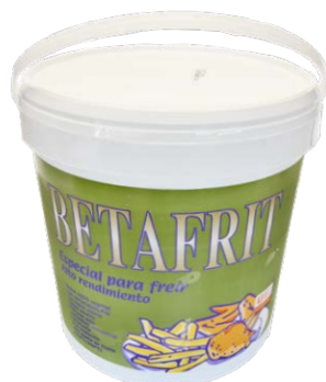
Cubo de aceite líquido para freir Betafrit 105242 10 L Vida útil: 12 meses