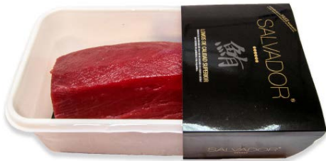
Lomo de atún extra ATM

186 2~4 kg/un | a peso Vida útil: 10 días