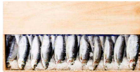
Sardinas extra 9010 1 x 44 un Vida útil: 6 meses