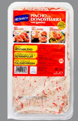
Pincho a la donostiarra con gambas 9640 6 x 1 kg Vida útil: 60 días