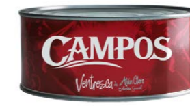
Lata de ventresca de atún claro en aceite de girasol 53040 12 x 900 g (P.Esc: 650 g) Vida útil: 6 años