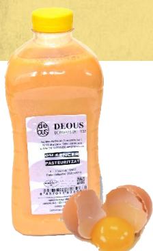
Huevo entero pasteurizado 52798 10 x 1 L Vida útil: 30 días