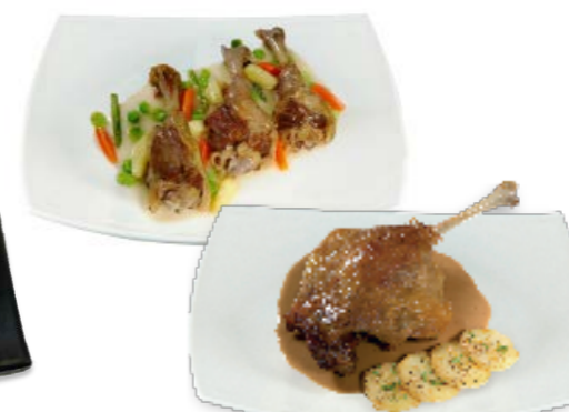
Muslos y codillos de pato en confit 52165 Muslos | 10 un/lata | Vida útil: 4 años 52167 Codillos | 24 un/lata | Vida útil: 4 años