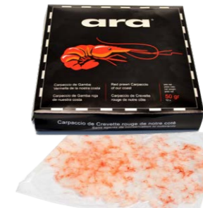
Carpaccio de gamba de la costa 52818 1 x 12 un (50 g/un) Vida útil: 1 año